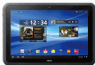
ARROWS Tab WiFi

10.1インチ液晶の富士通製タブレット端末。防水機能対応なので、本体が濡れることを気にせずにお風呂やキッチンでご利用いただけます。また、デュアルコアCPUの搭載により、ストレスフリーな操作性も実現!